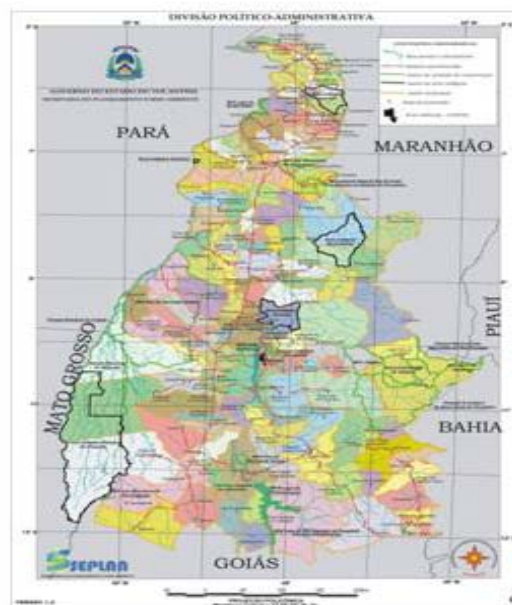
Figura 2 – Localização de Ponte Alta do Tocantins no mapa do Estado do Tocantins (Fonte: SEPLAN, 2005).

O município de Ponte Alta do Tocantins está localizado na biorregião do Jalapão na porção leste do estado do Tocantins, apresenta como coordenadas geográficas 10° 44' 38" de latitude sul, 47° 32' 10" de longitude oeste e altitude média de 294 metros, distante 198 quilômetros da capital, Palmas (Figura 2). Limita-se ao norte com os municípios de Santa Tereza do Tocantins, Lagoa do Tocantins e Novo Acordo, ao sul com Pindorama e Almas, ao leste com Mateiros e a oeste com Monte do Carmo e Silvanópolis.