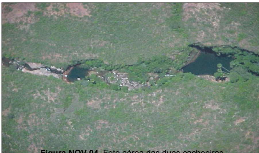
Figura NOV 04. Foto aérea das duas cachoeiras