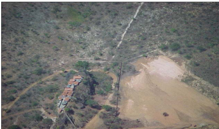
Figura NOV 06. Foto da Pousada Ecológica