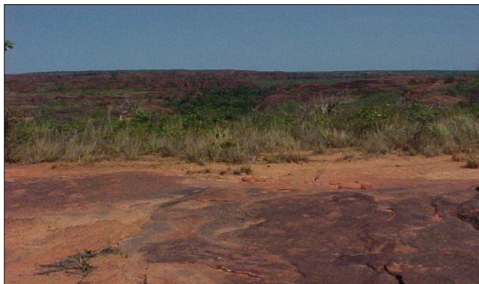
Figura NOV 03. Foto da Serra do Gorguino