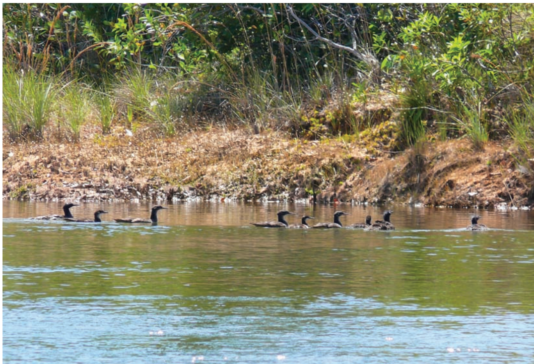
Figura 3. Dois casais de Mergus octosetaceus e seus filhotes visualizados simultaneamente (Marcelo Barbosa)