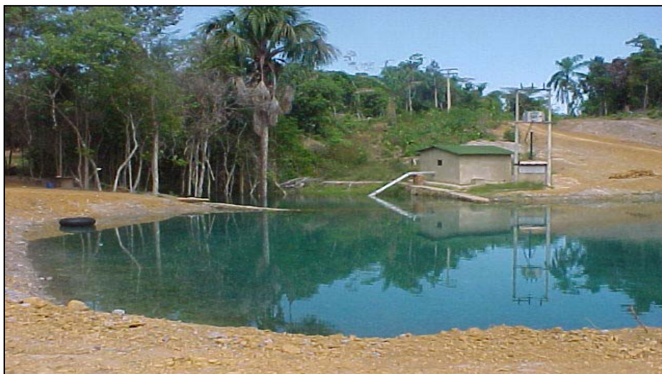
Figura APA 02. Foto da Lagoa do Luizão