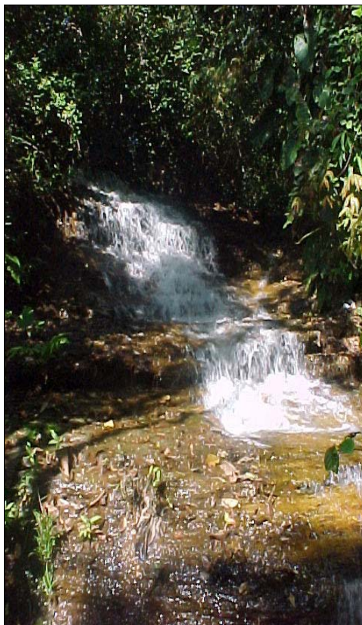
Figura APA 03. Foto da Cachoeira da Amélia