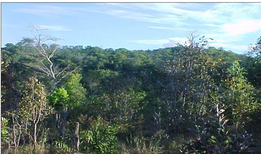
Figura APA 06. Foto da área da Cachoeira do Santana