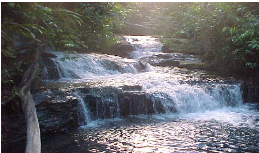
Figura APA 05. Foto da Cachoeira do Veloso